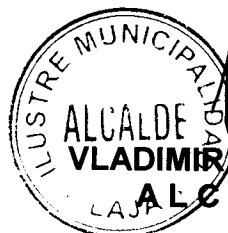
VLADIMIR FICA TOLEDO ALCALDE