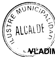
VLADIMIR FICA TOLEDO ALCALDE