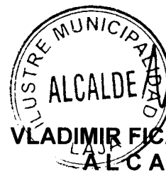
VLADIMIR FICA TOLEDO ALCALDE